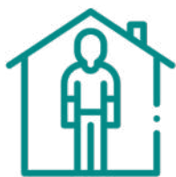
PROTOCOLOS DE ISOLAMENTO