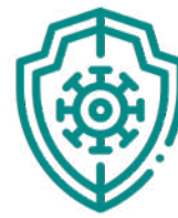
MEDIDAS DE SEGURANÇA ADICIONAIS