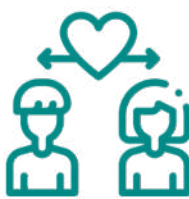
PROGRAMAS DE EVENTOS SEGUROS