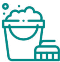
REGIME DE LIMPEZAS EXTENSIVO

Os Serviços de Apoio ao COVID-19 da The Baron's Residence são especializados: