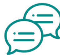
COMUNICAÇÕES SOBRE AS MELHORES PRÁTICAS